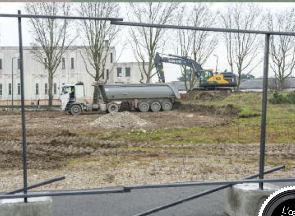
Travaux de l'école Beauverie - le 12 janvier